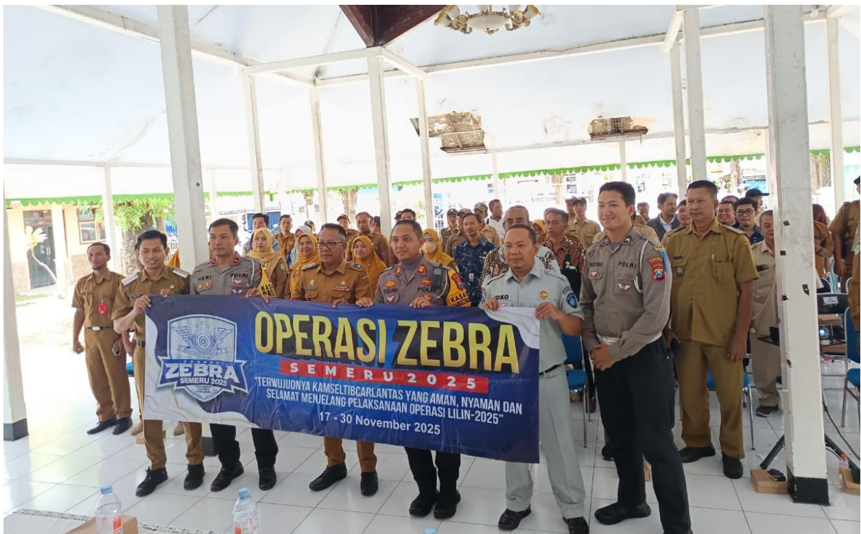
Gambar 8. Kegiatan Kolaborasi Pelaksanaan Sosialisasi Intensifikasi Keselamatan Transportasi Bersama Jasa Raharja