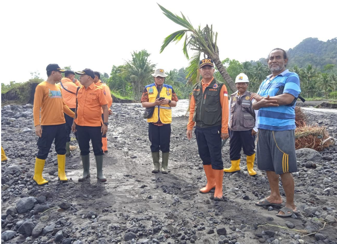
Gambar 3. Kegiatan Pemantauan Wilayah Terdampak Banjir Lahar Dingin di Desa Gondoruso