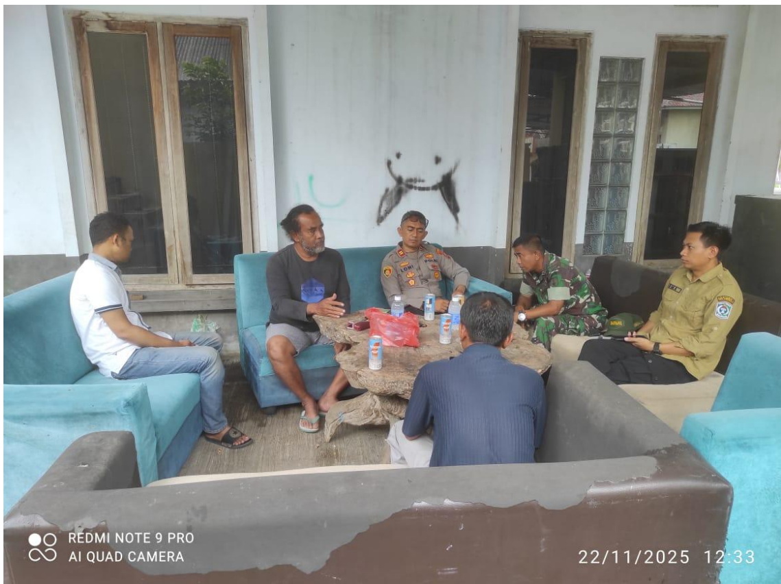
Gambar 4. Koordinasi Pencegahan dan Pengendalian Gangguan Keamanan dan Ketertiban Akibat Masalah Tambang Pasir bersama Forkopimca