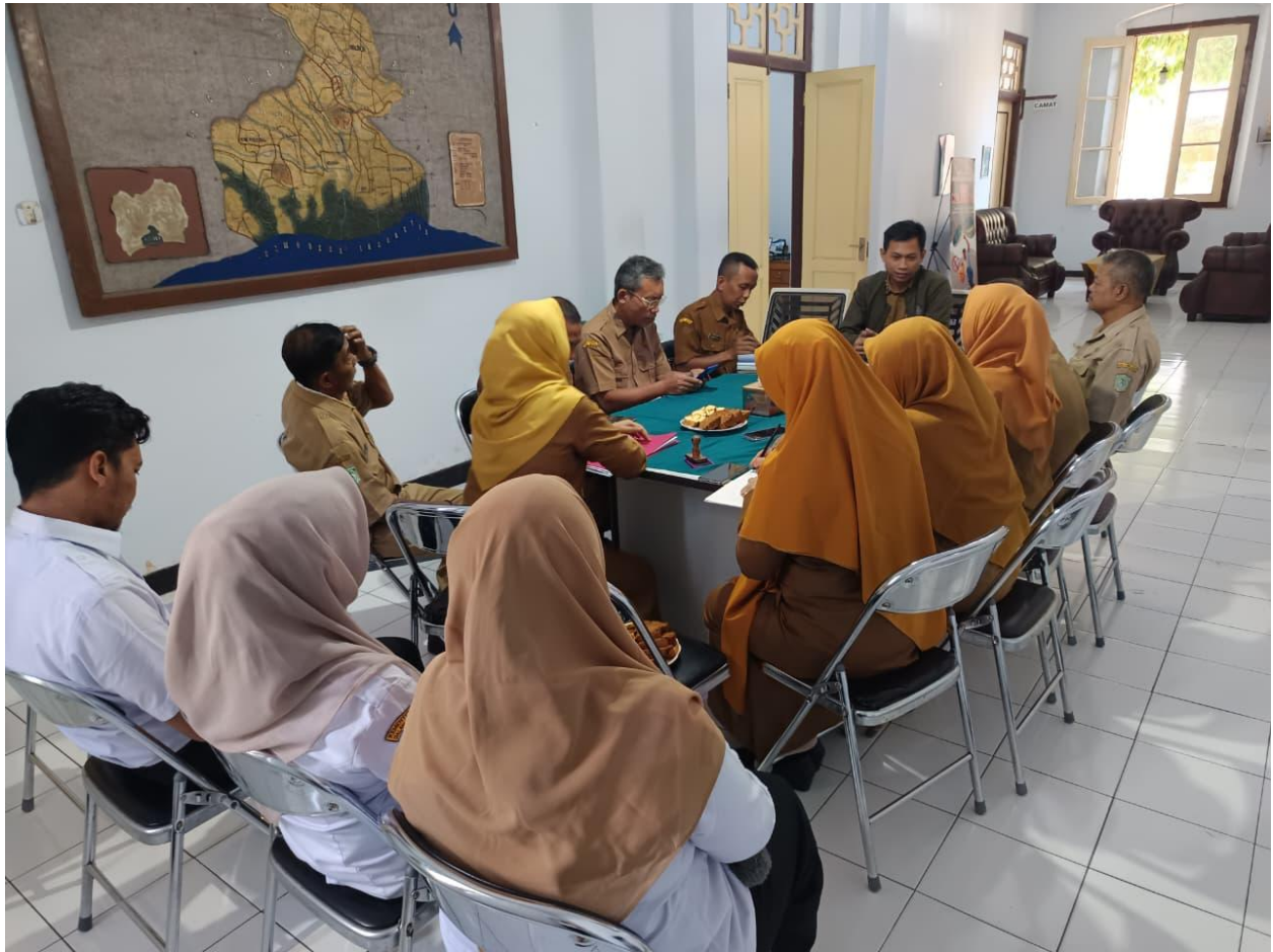
Gambat 5. Rapat Koordinasi Internal Pegawai Kecamatan Pasirian