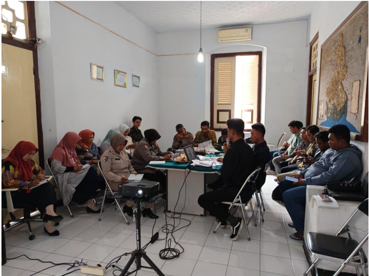
Gambar 7. Kegiatan Koordinasi Persiapan Pelaksanaan Makanan Bergizi Gratis di Wilayah Kecamatan Pasirian bersama Forkopimca dan Pengurus Dapur/SPPG MBG