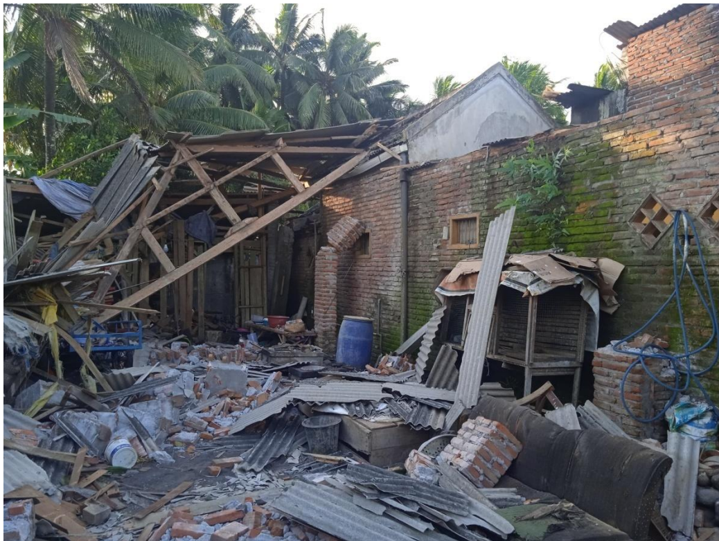
Gambar 2. Kegiatan Pemantauan Rumah Roboh Akibat Cuaca Ekstrim di Desa Gondoruso