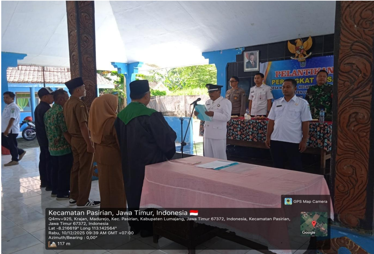
Gambar 1. Giat Fasilitasi Pelantikan Perangkat Desa di Kantor Kepala Desa Madurejo