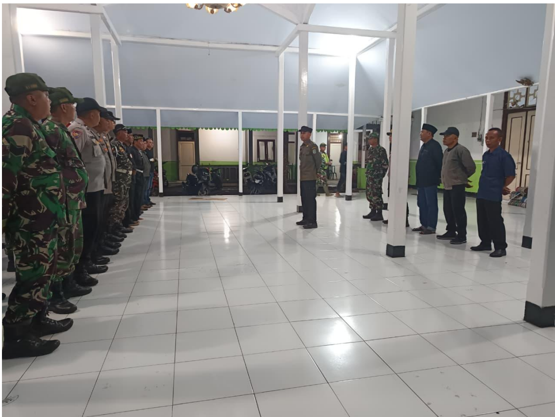
Gambar 9. Apel bersama Forkopimca, Pemerintah Desa, Satgas, Banser, dan Organisasi Pencak Silat Dalam Rangka Persiapan Pengamanan Peringatan Pergantian Tahun Baru 2026