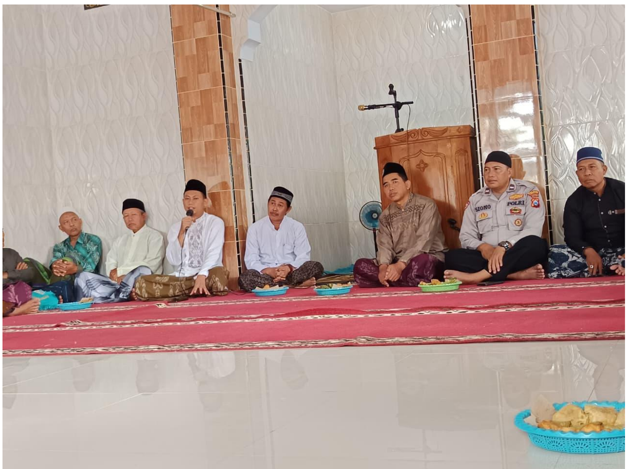
Gambar 6. Kegiatan Safarai Sholat Jumat bersama Forkopimca dan KUA di Masjid At-Taqwa Desa Nguter