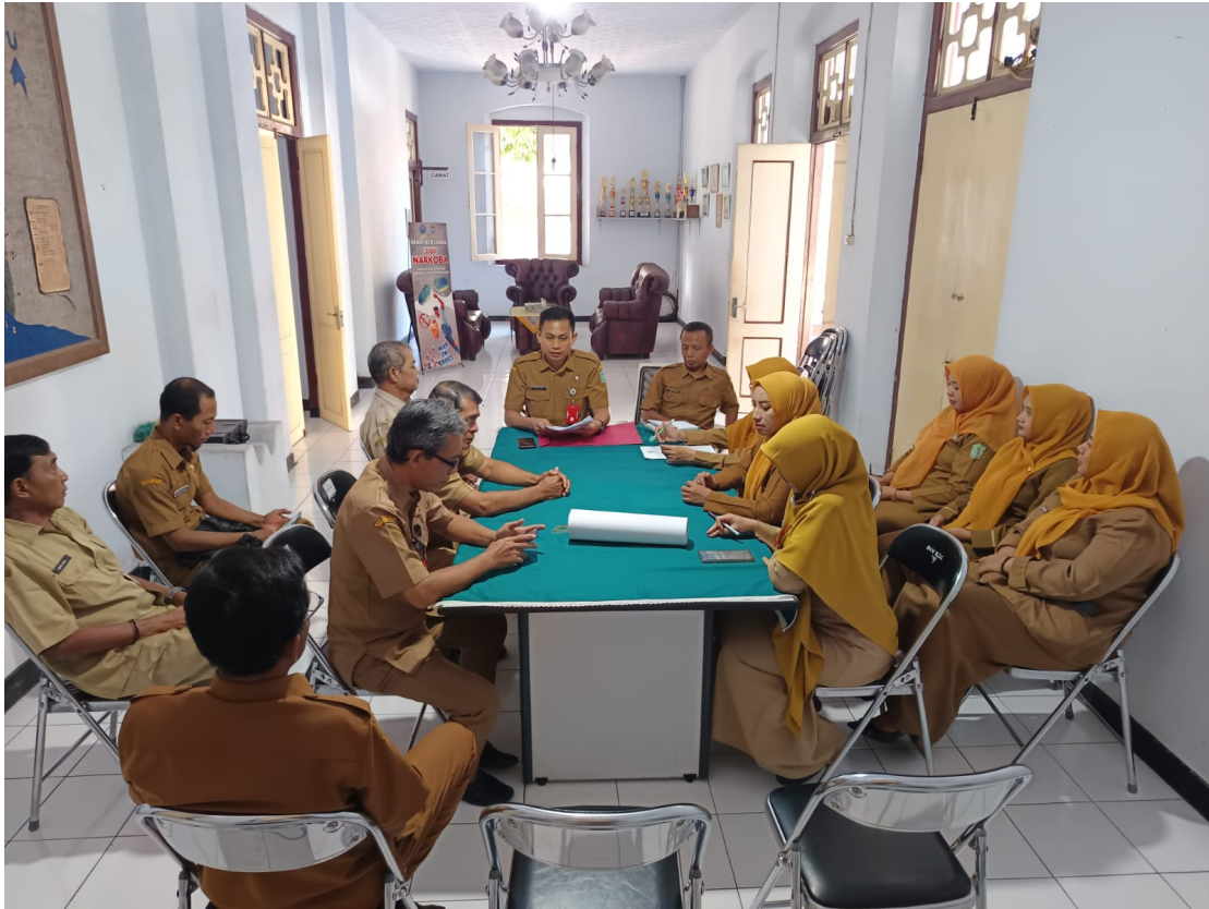
Gambat 5. Rapat Koordinasi Internal Pegawai Kecamatan Pasirian