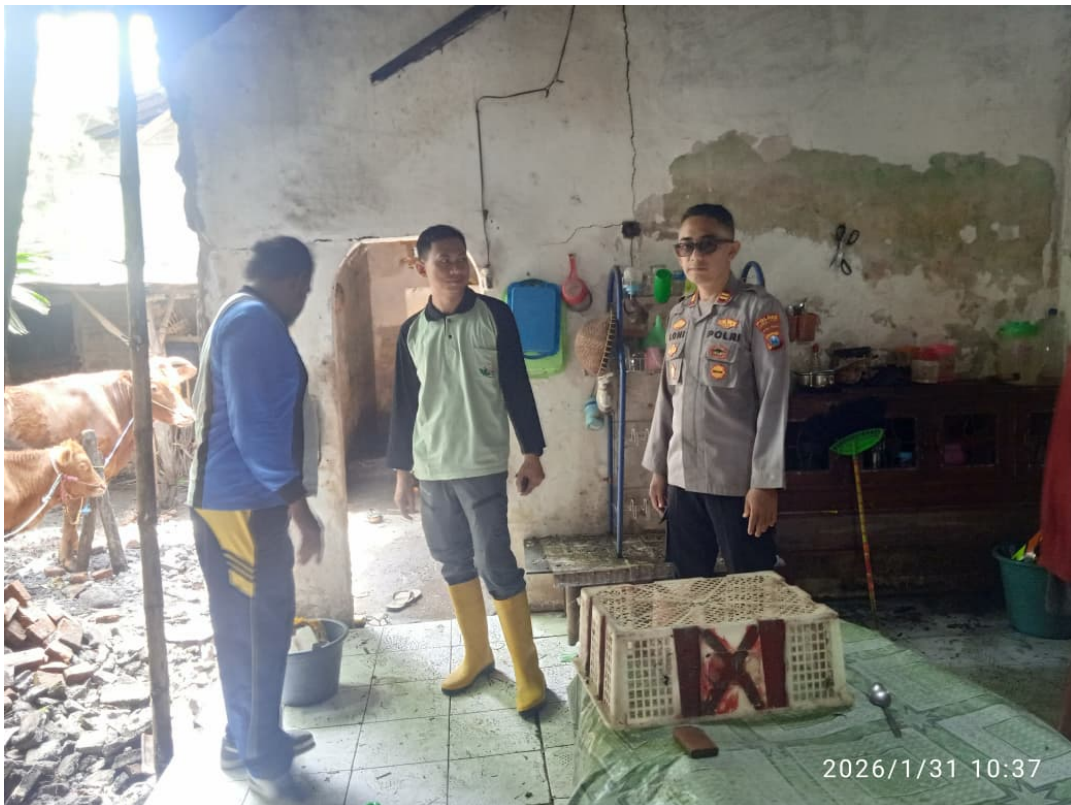
Gambar 2. Kegiatan Pemantauan Rumah Roboh Akibat Cuaca Ekstrem di Desa Gondoruso