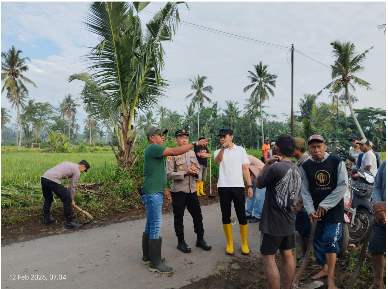
Gambar 7. Kegiatan Karya Bhakti Gerakan Asri bersama Koramil 0821-08 Pasirian dan Pemerintah Desa Bades.