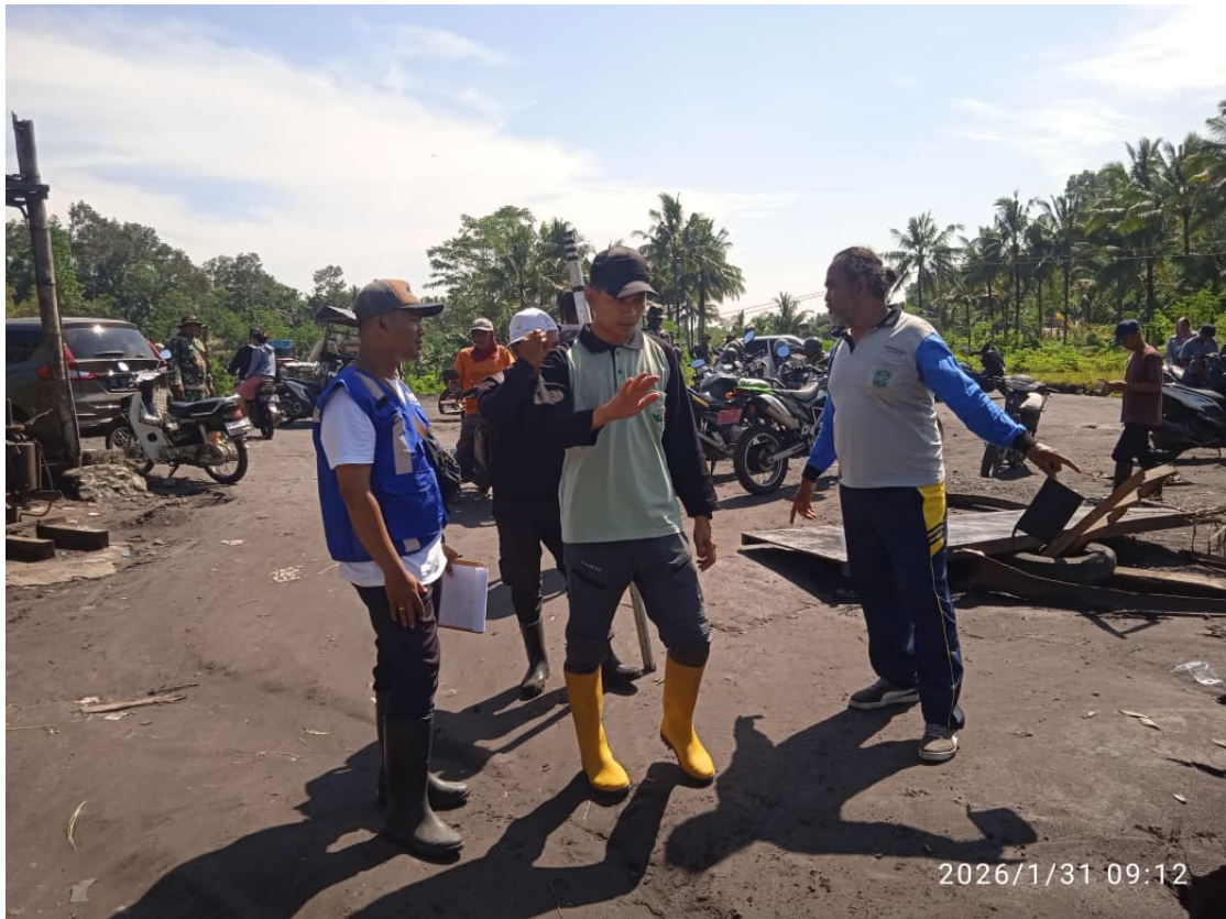
Gambar 3. Kegiatan Pemantauan Wilayah Terdampak Banjir Lahar Dingin di Desa Gondoruso