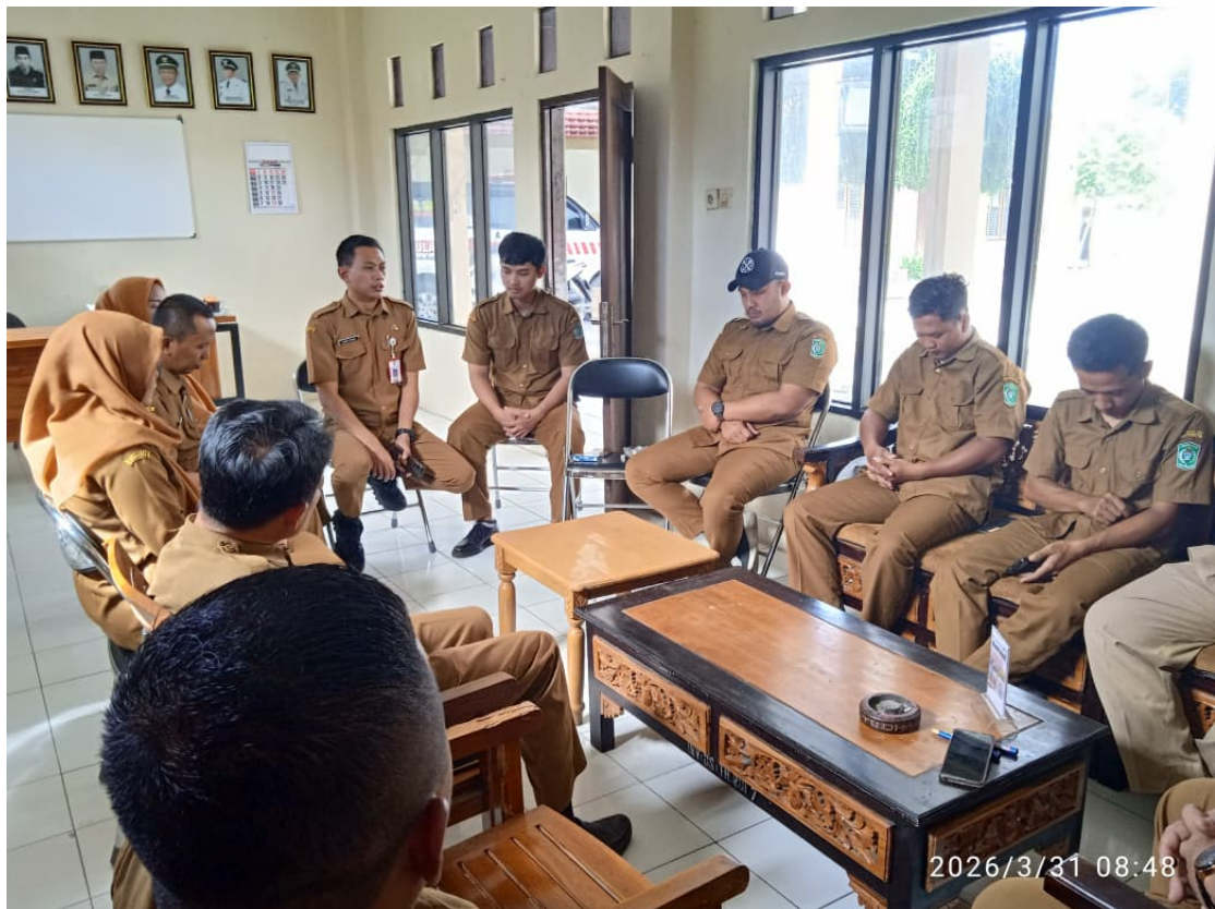
Gambar 4. Kegiatan Pembinaan Perangkat Desa Bago