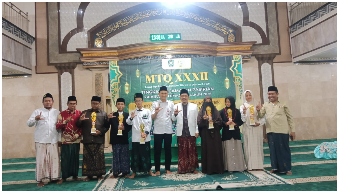
Gambar 6. Kegiatan Fasilitasi Lomba MTQ Tingkat Kecamatan Pasirian