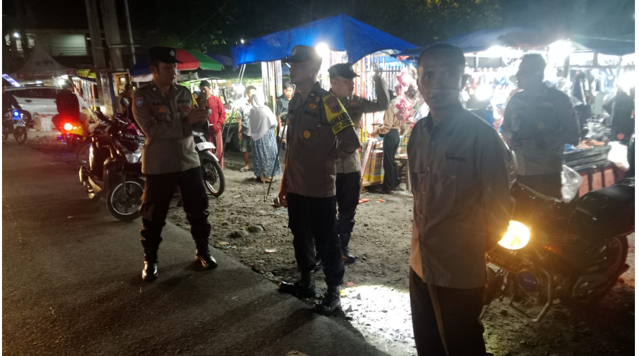
Gambar 9. Kegiatan Patroli bersama Forkpimca dalam rangka pengamanan Malam Takbir memperingati Hari Raya Idul Fitri 1447