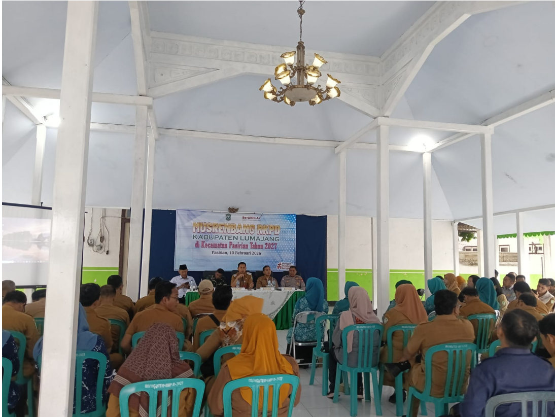
Gambar 1. Giat Fasilitasi Pelaksanaan Musrenbang RKPD di Kecamatan Pasirian Tahun 2027