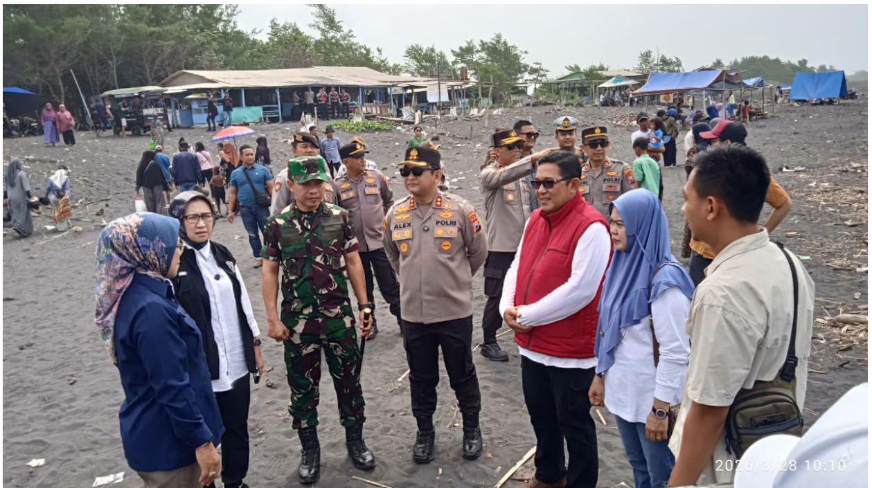
Gambar 8. Kegiatan Pendampingan Forkopimda dalam Pengawasan Tempat Wisata pada masa Libur Idul Fitri