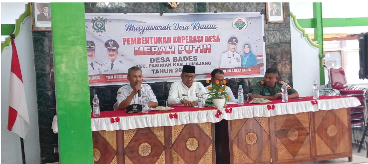
Gambar 2. Kegiatan Fasilitasi Pembentukan Koperasi Desa Merah Putih di Kantor Kepala Desa Bades