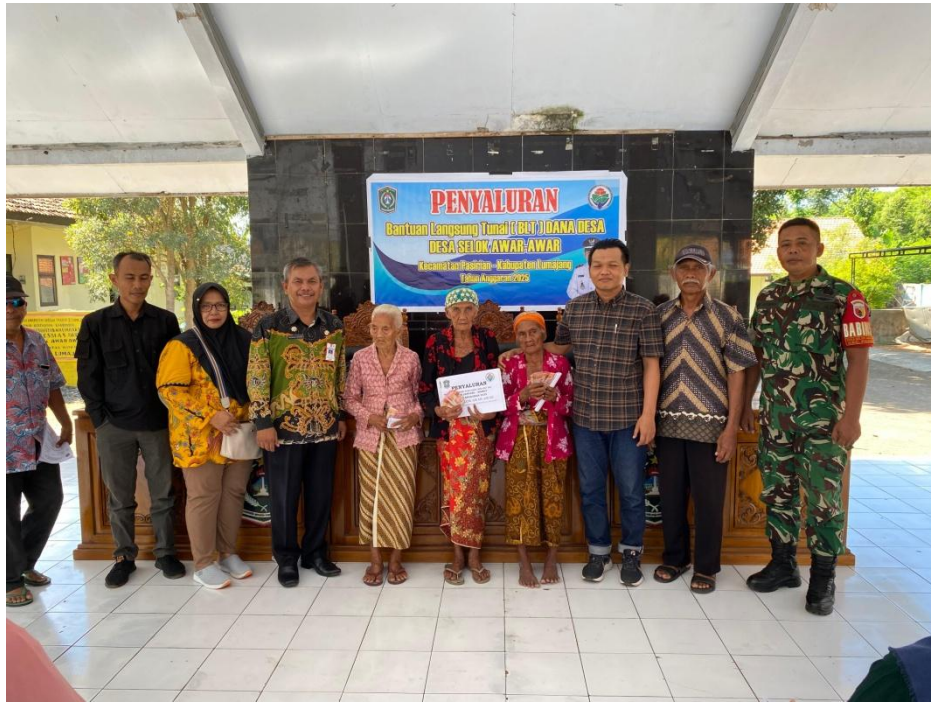
Gambar 3. Kegiatan Pendampingan Pembagian BLT DD di Kantor Kepala Desa Selok Awar-Awar