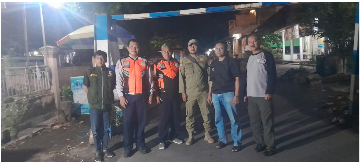
Gambar 6. Giat Penjagaan Portal di Jalan Raya Gondoruso bersama dengan Polsek Pasirian, Dishub, dan Satpol PP