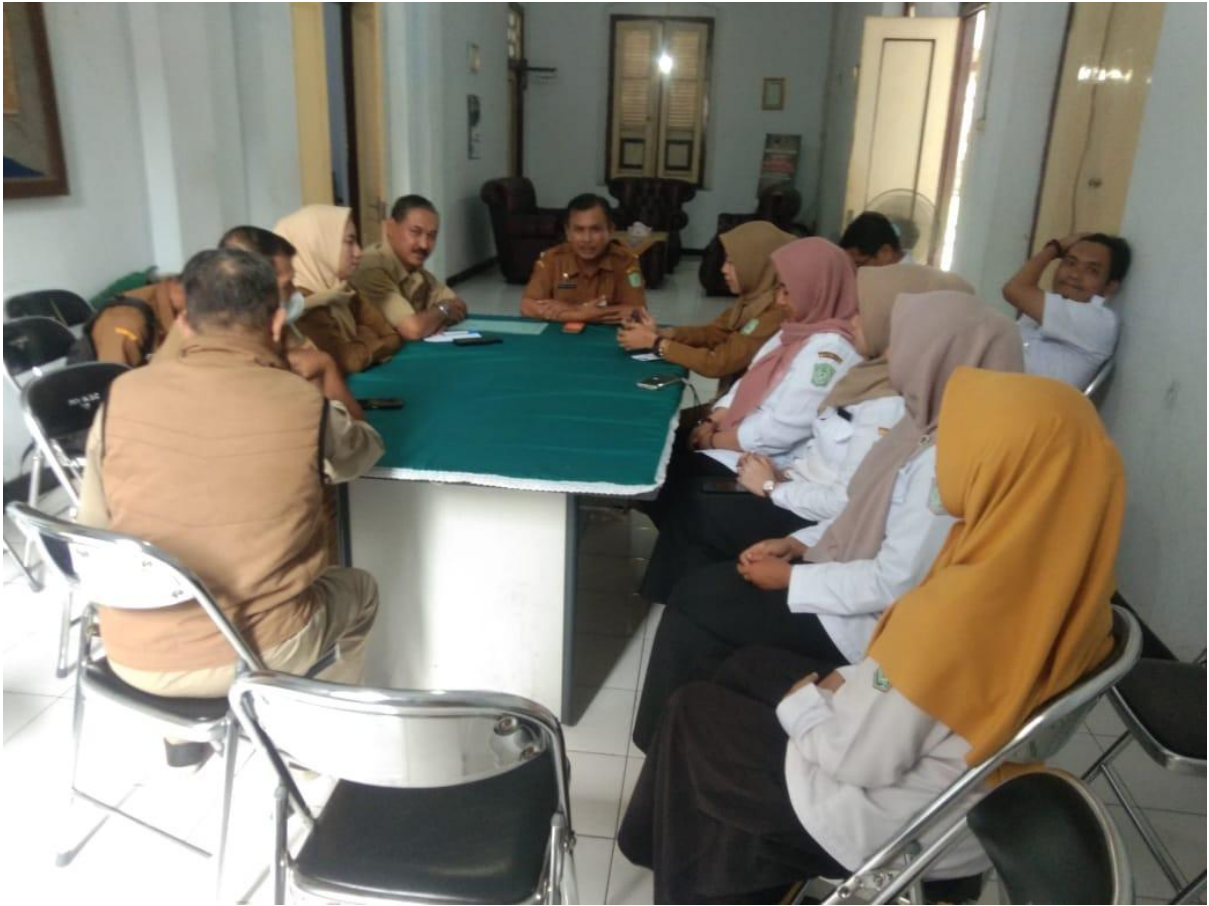
Gambat 5. Rapat Koordinasi Internal Pegawai Kecamatan Pasirian