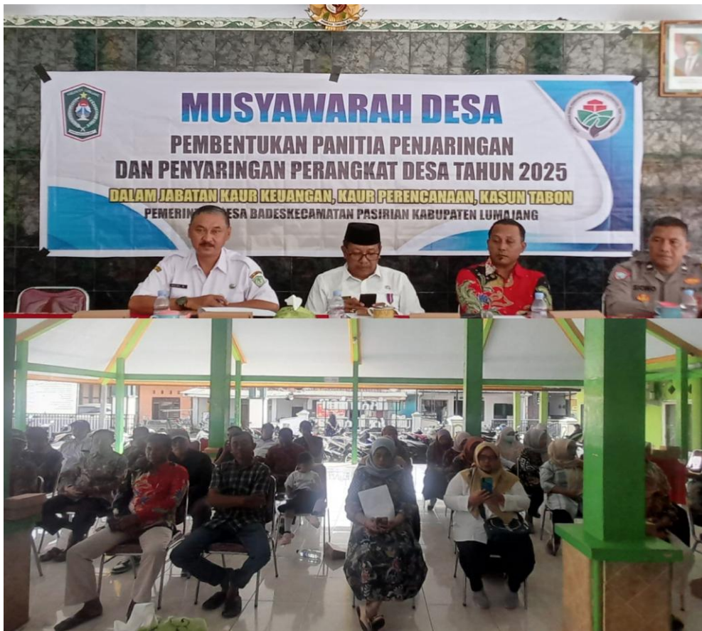
Gambar 1. Giat Fasilitasi Penjaringan dan Penyaringan Perangkat Desa di Kantor Kepala Desa Bades